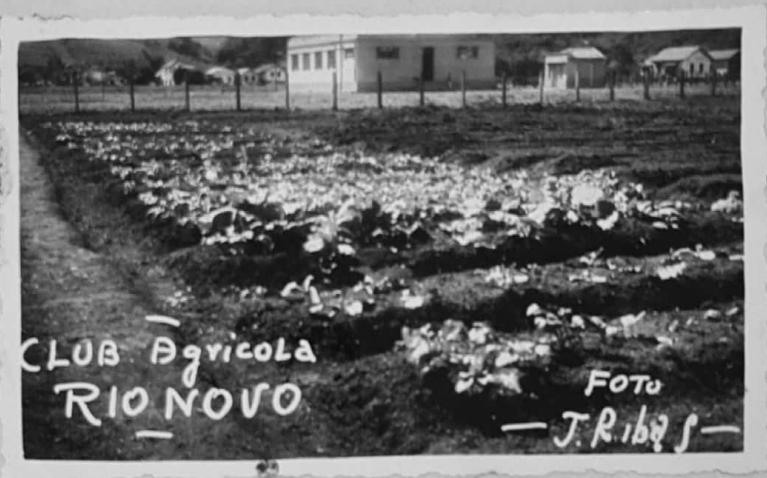
CLUB Agrícola RIO NOVO