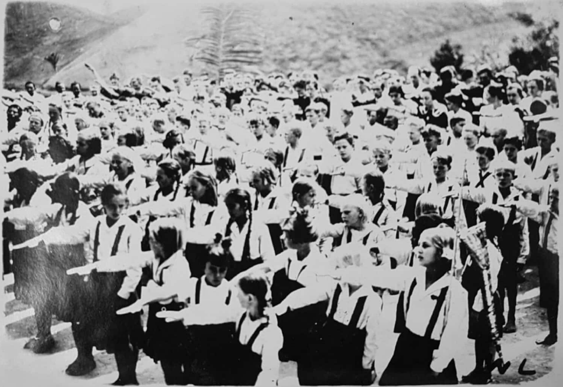
GRUPO ESCOLAR RURAL DE SANTA MARIA