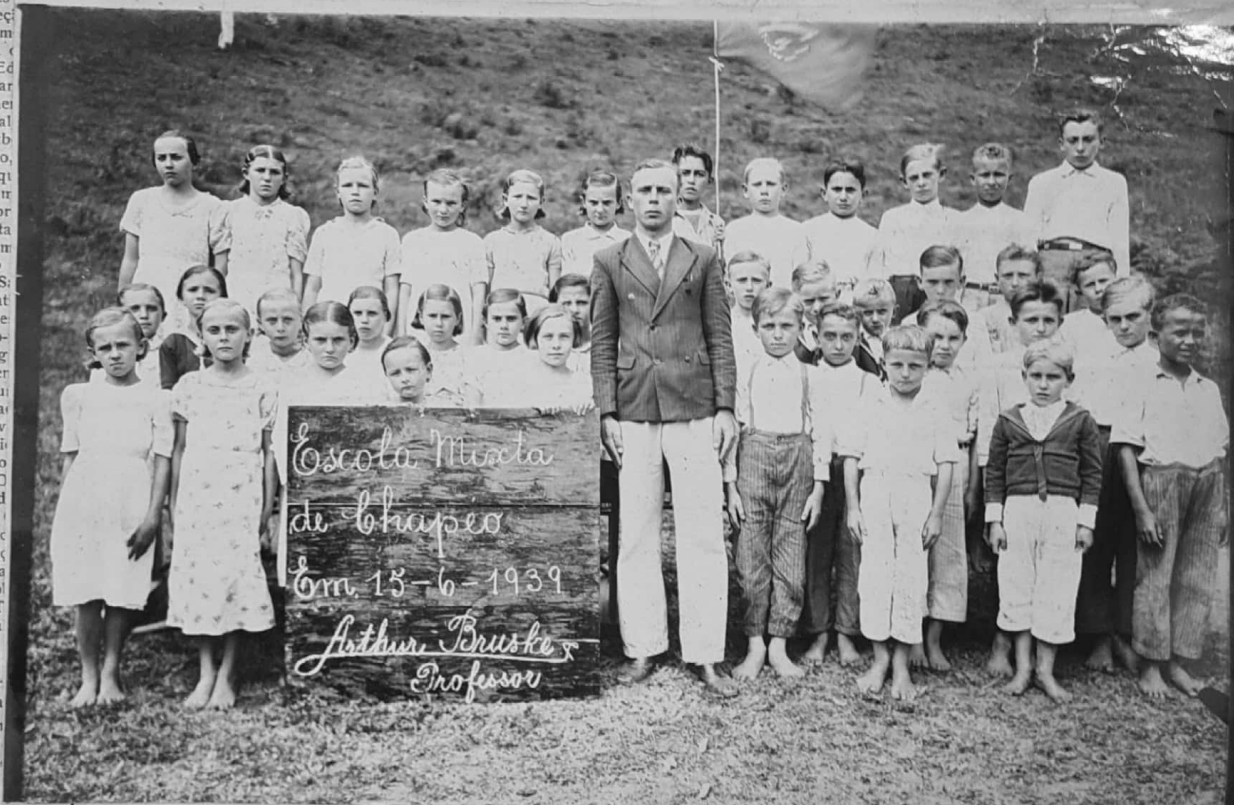
ESCOLA MIXTA DE CHAPÉO