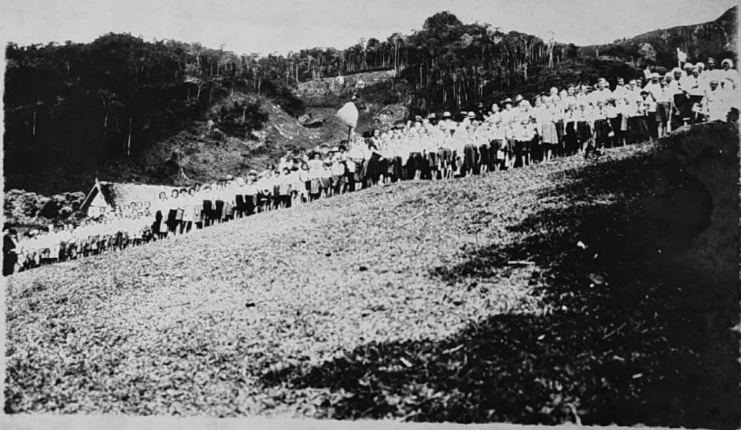
ESCOLA DE ARREPENDIDO