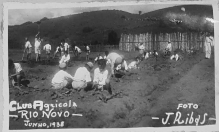
CLUB Agrícola RIO NOVO JUNHO, 1938