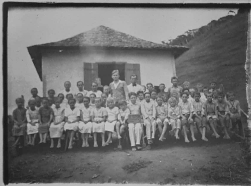
ESCOLA DE SÃO SEBASTIÃO