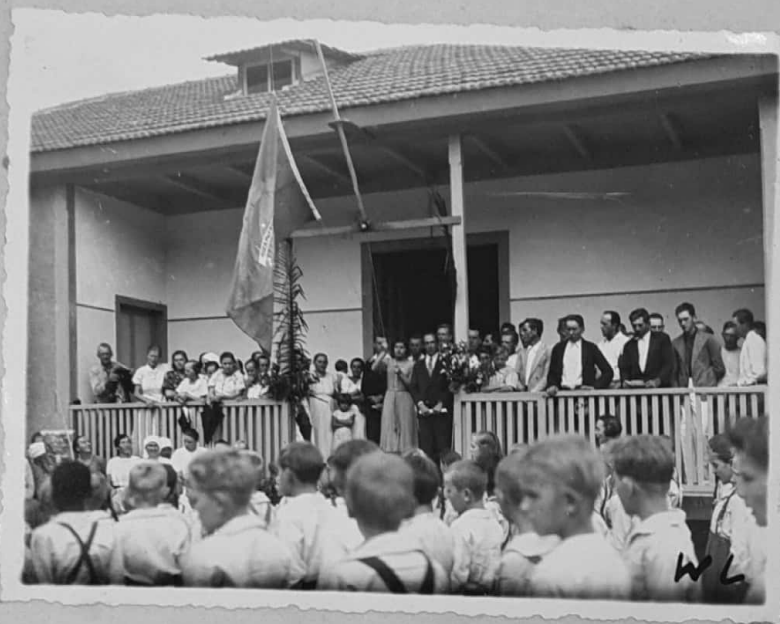
ASPECTO DE UMA FESTA CIVICA NO GRUPO ESCOLAR RURAL DE SANTA MARIA - MUNICIPIO DE SANTA LEOPOLDINA