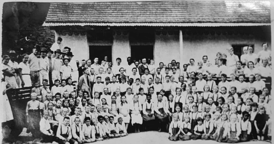
Festa da Aniversaria 21.9.36.