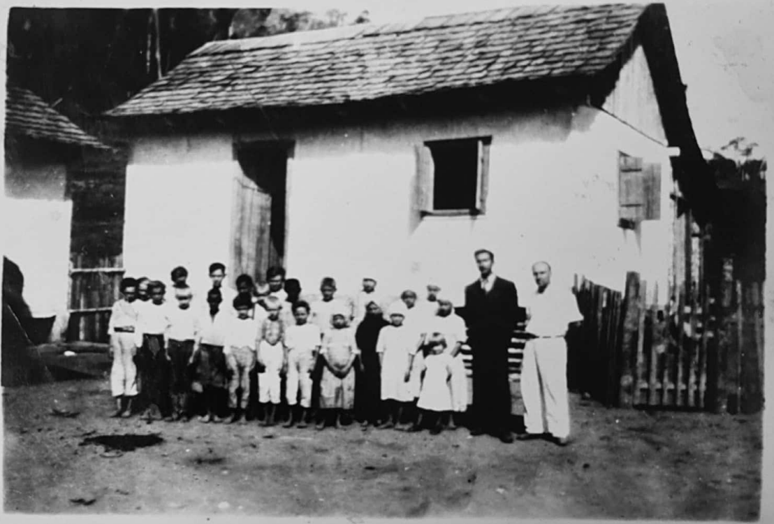
ESCOLA DE RIO TAQUARA