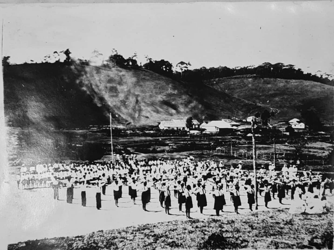
GRUPO ESCOLAR RURAL DE PALMEIRA