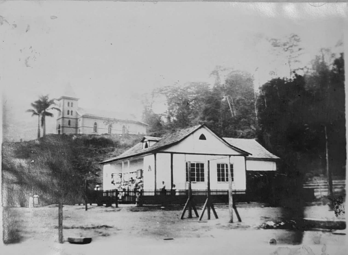
GRUPO ESCOLAR RURAL DE LARANJA DA TERRA