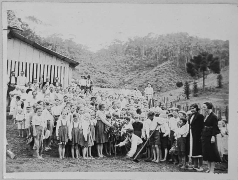
GRUPO ESCOLAR RURAL DE SANTA MARIA