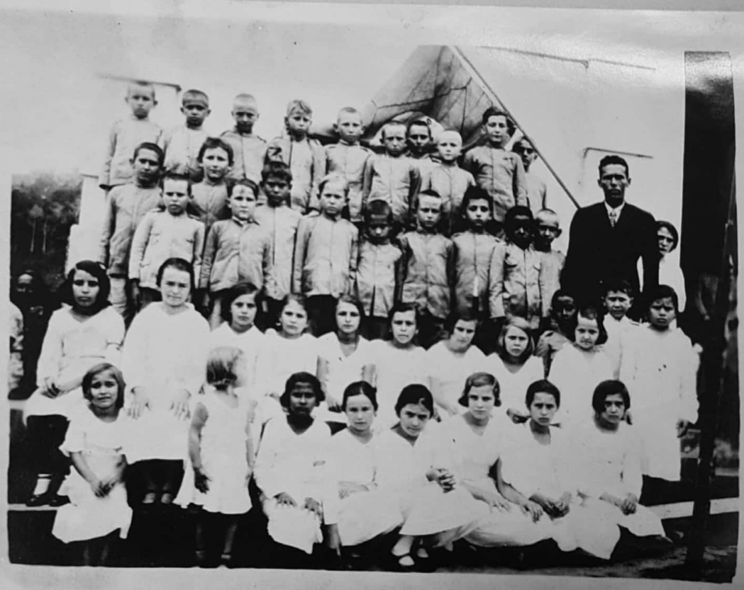
ESCOLA DE SÃO PAULO DO RIO PERDIDO