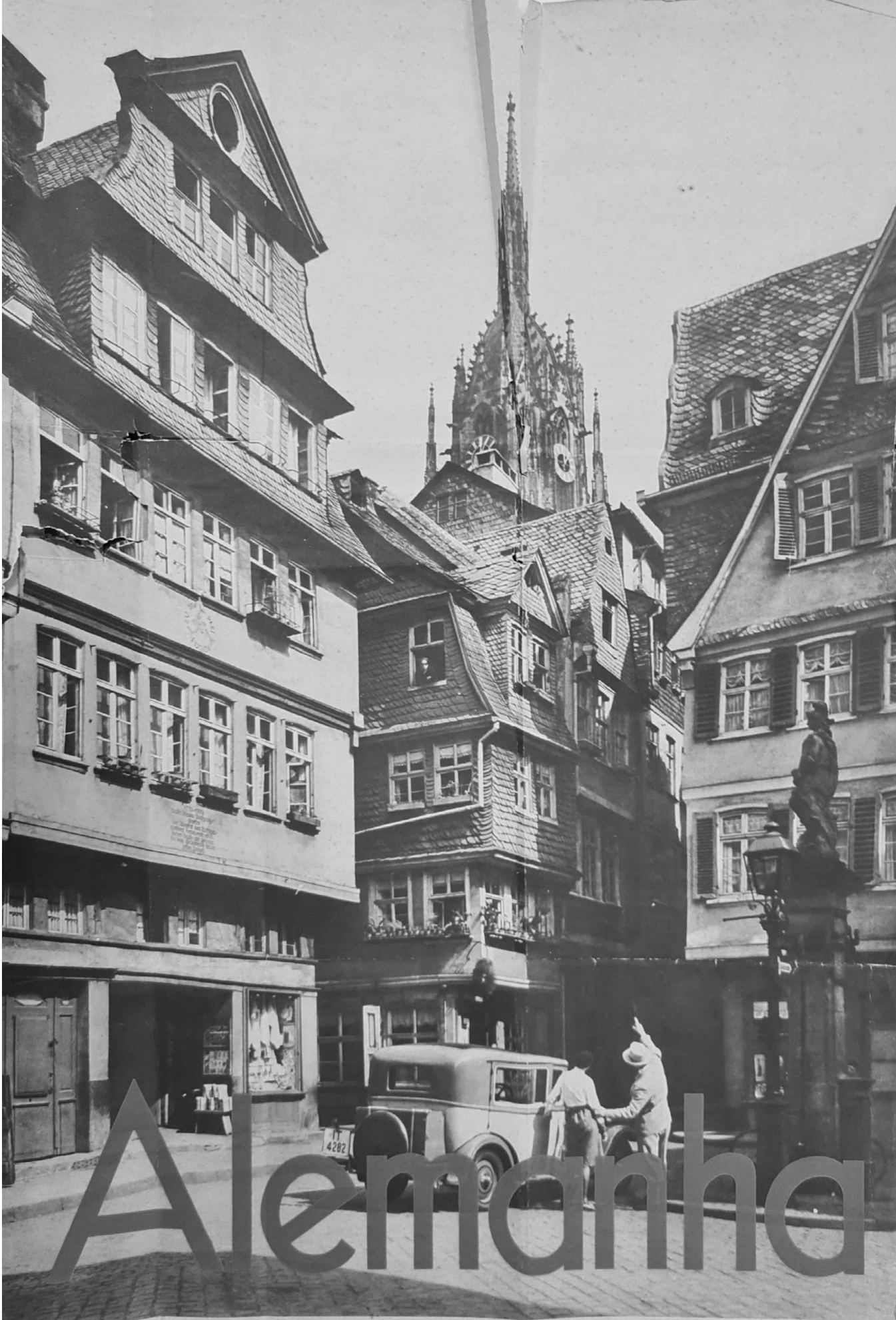
Hesse-Nassau: Francfort do Meno