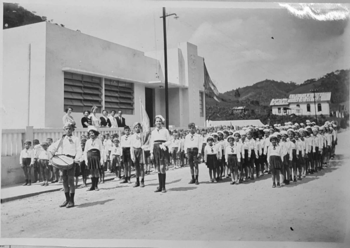
DESFILE DO GRUPO ESCOLAR "TEOFILO PAULINO"

NA SÉDE DO MUNICIPIO DE DOMINGOS MARTINS - NO DIA DA PATRIA