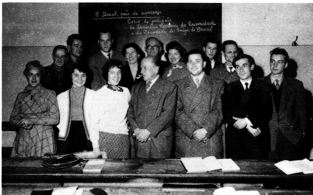
Portugiesischer Sprachkursus an der Universität München

Besuch des Präsidiums bei S. K. H. Herzog Albrecht von Bayern in Schloss Nymphenburg (Abreise S. K. H. nach Brasilien)