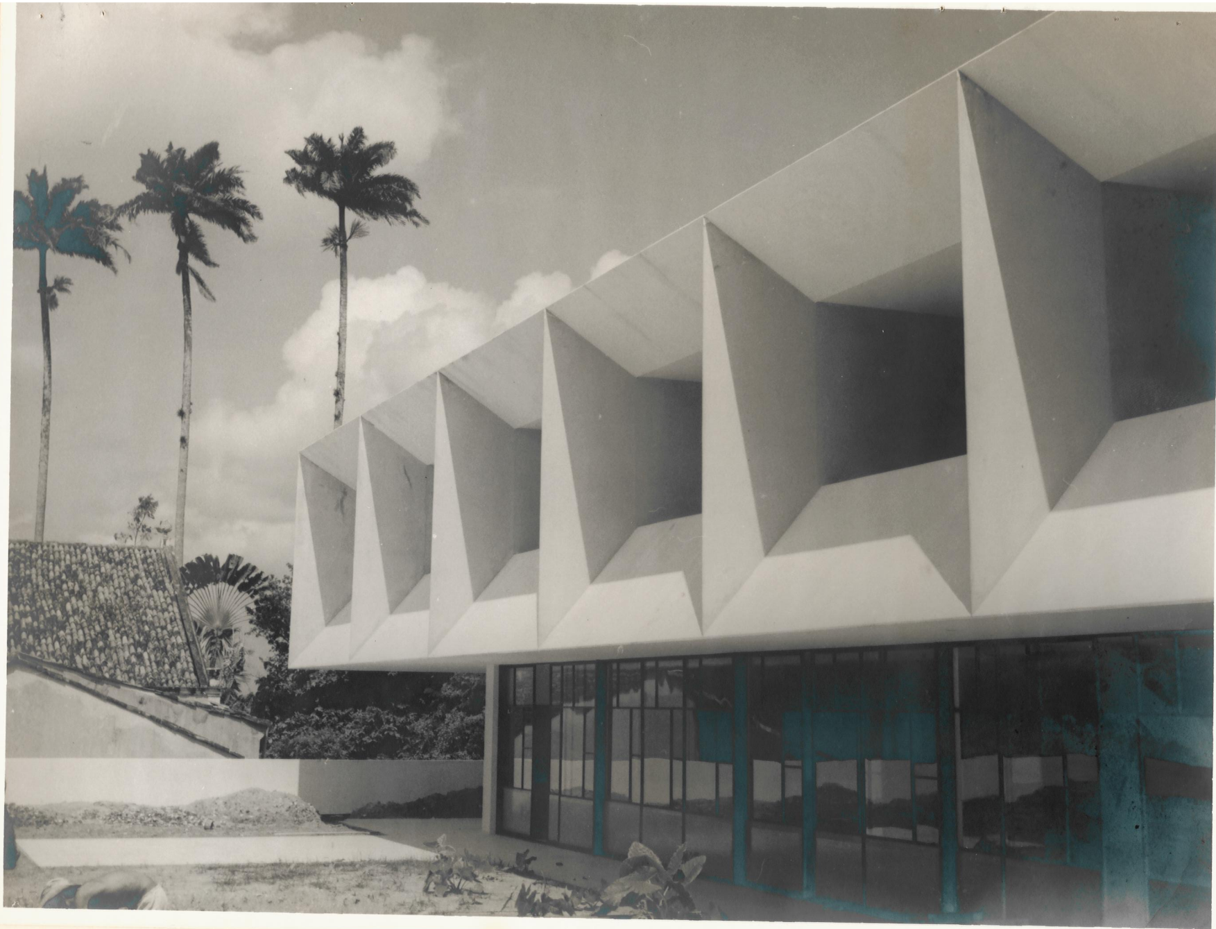
VISTA PARCIAL DA ESCOLA DE DEMONSTRAÇÃO DO CENTRO REGIONAL DO RECIFE