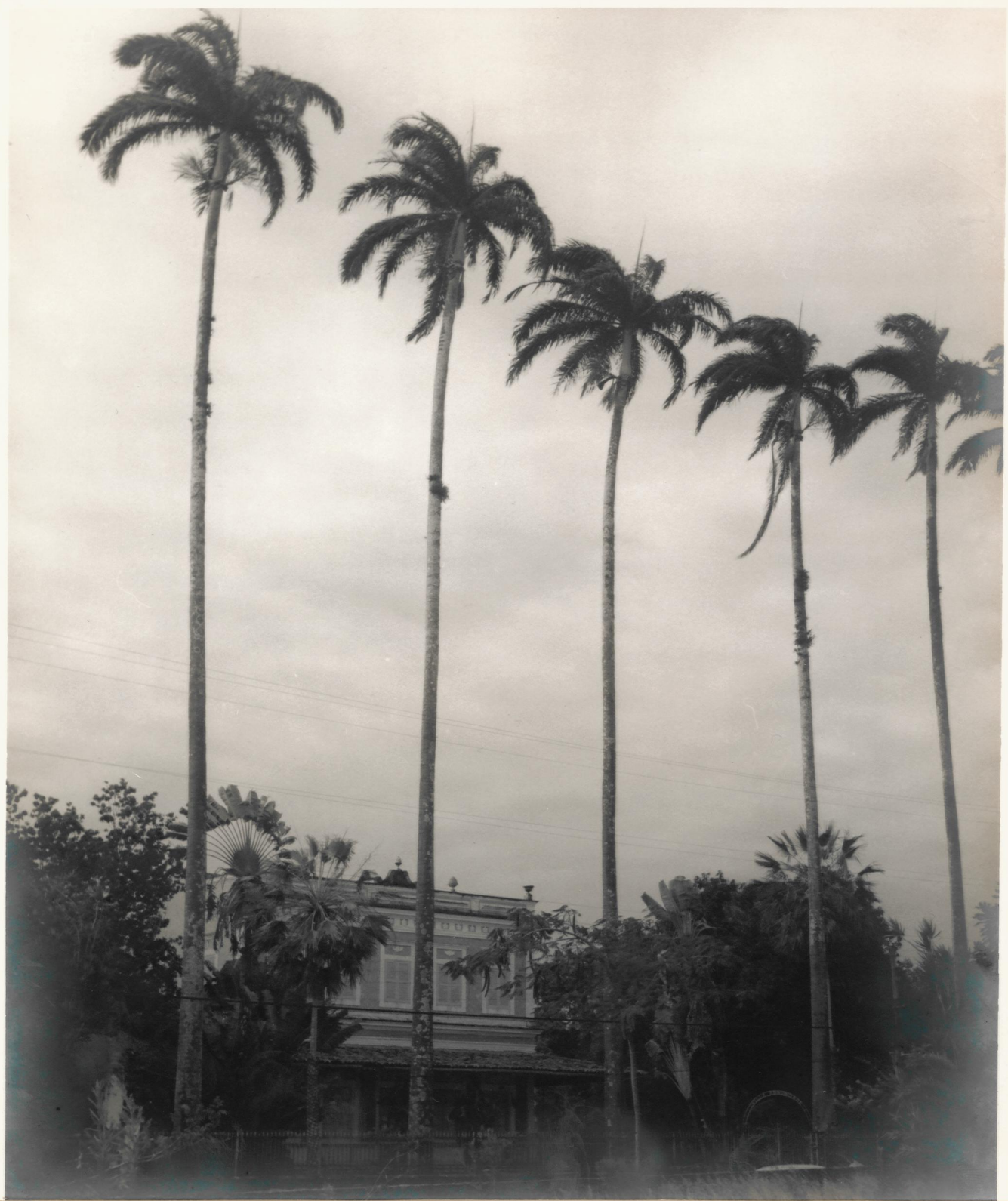
FACHADA DA VILA ANUNCIADA SEDE DO CENTRO REGIONAL DO RECIFE, VENDO-SE AS 6 PALMEIRAS