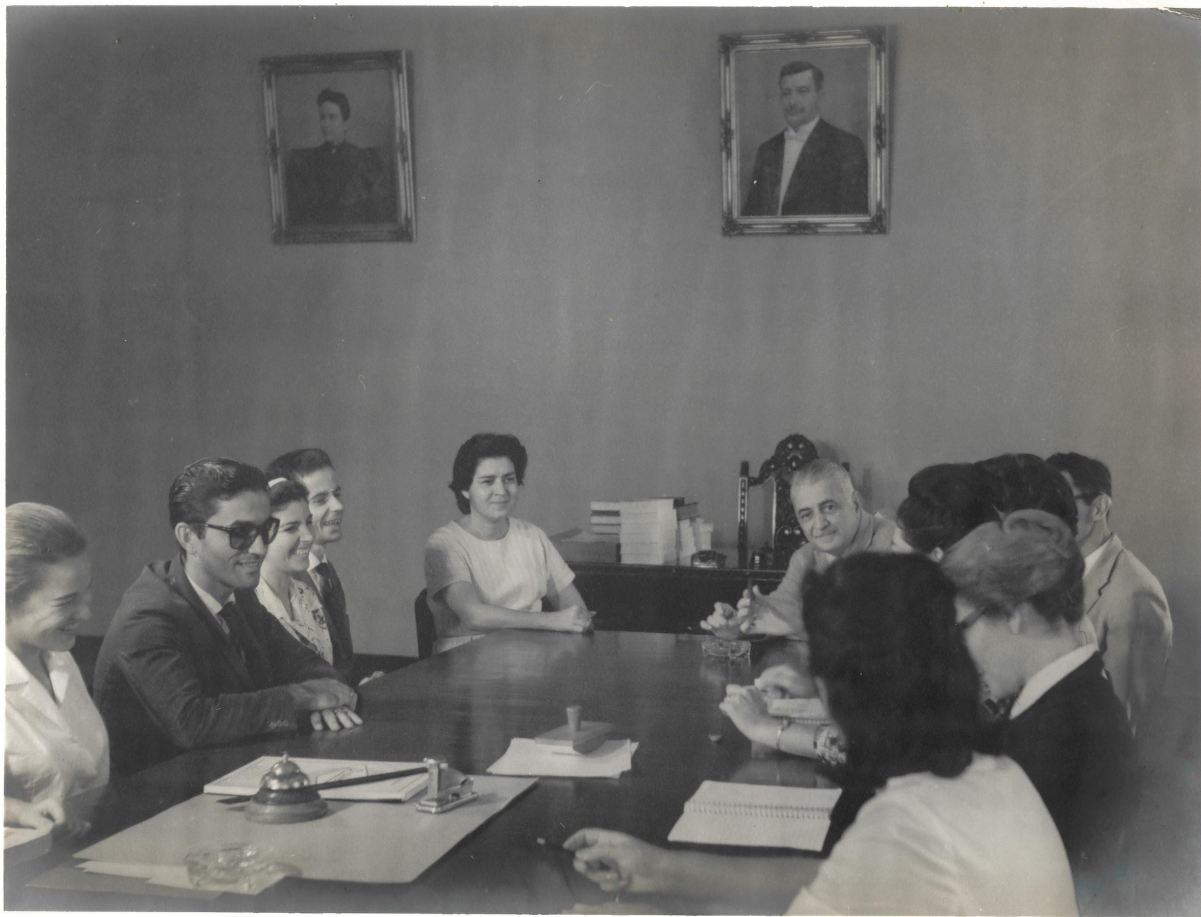
SALA DO DIRETOR GERAL DO CENTRO REGIONAL DO RECIFE ASPECTO DE UM SEMINÁRIO ENTRE TÉCNICOS DO CRR E DA SUDENE