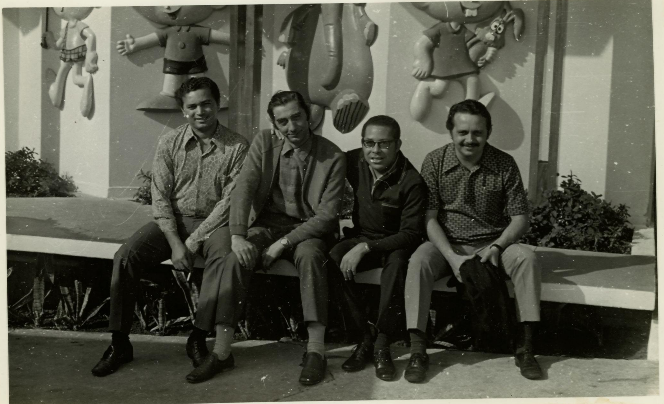
4. Visita a um Parque Infantil.