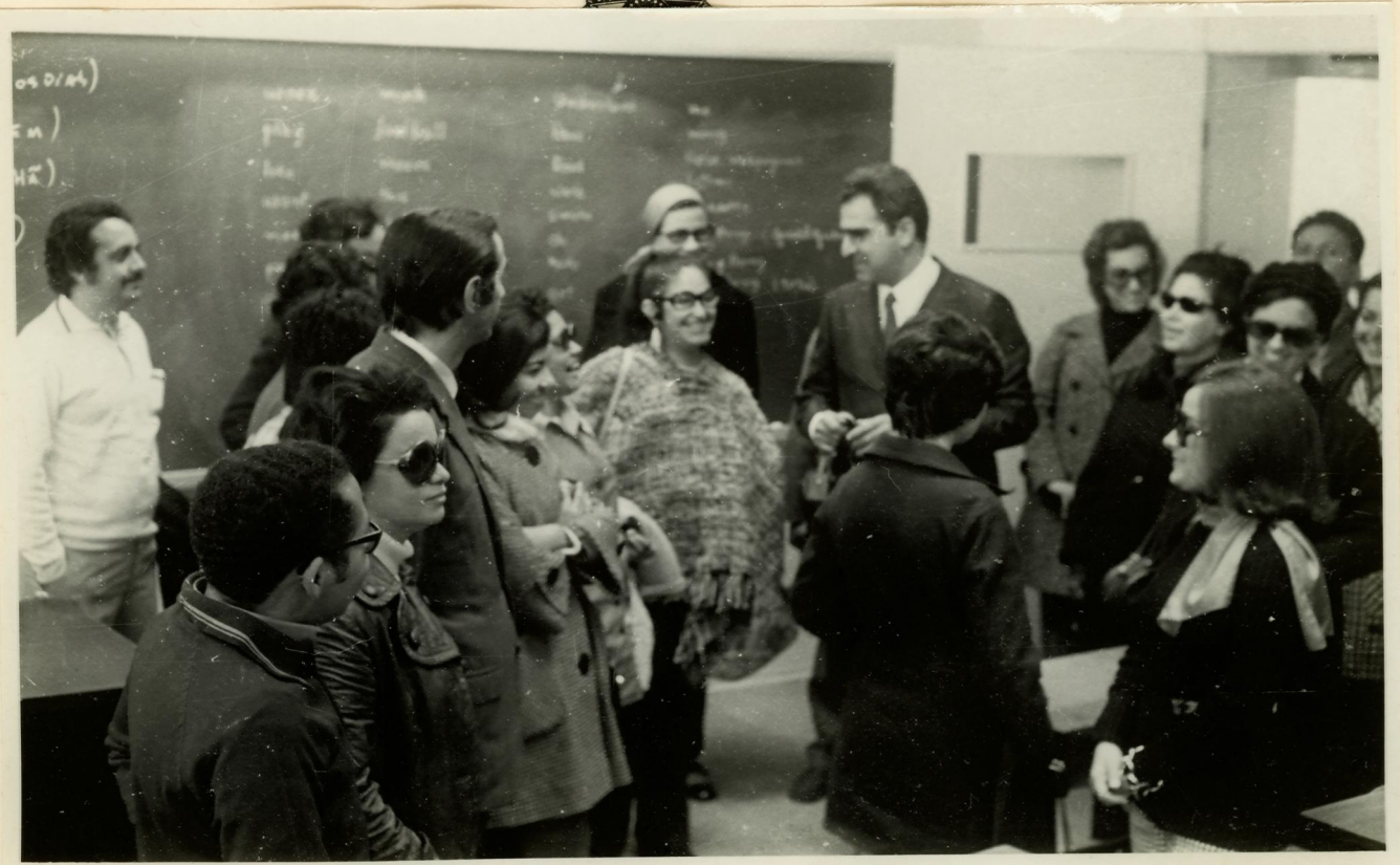
3. Visita a uma escola.