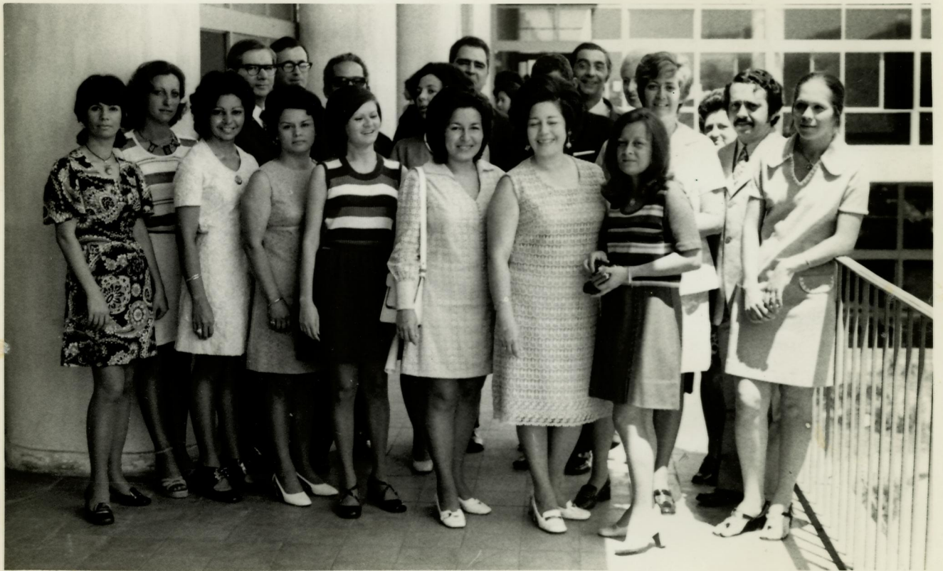
10. Bolsistas do II CASEAL.