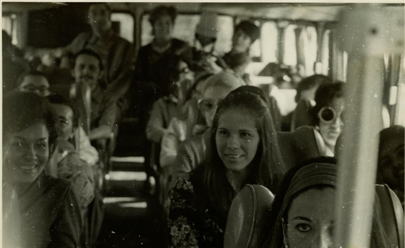
1. No ônibus, para realização de atividades programadas