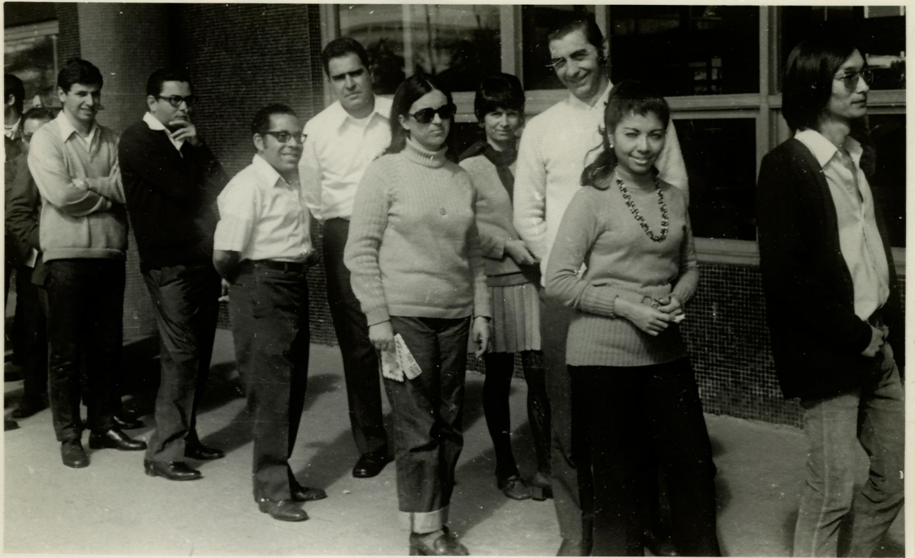
7. Na fila do restaurante.