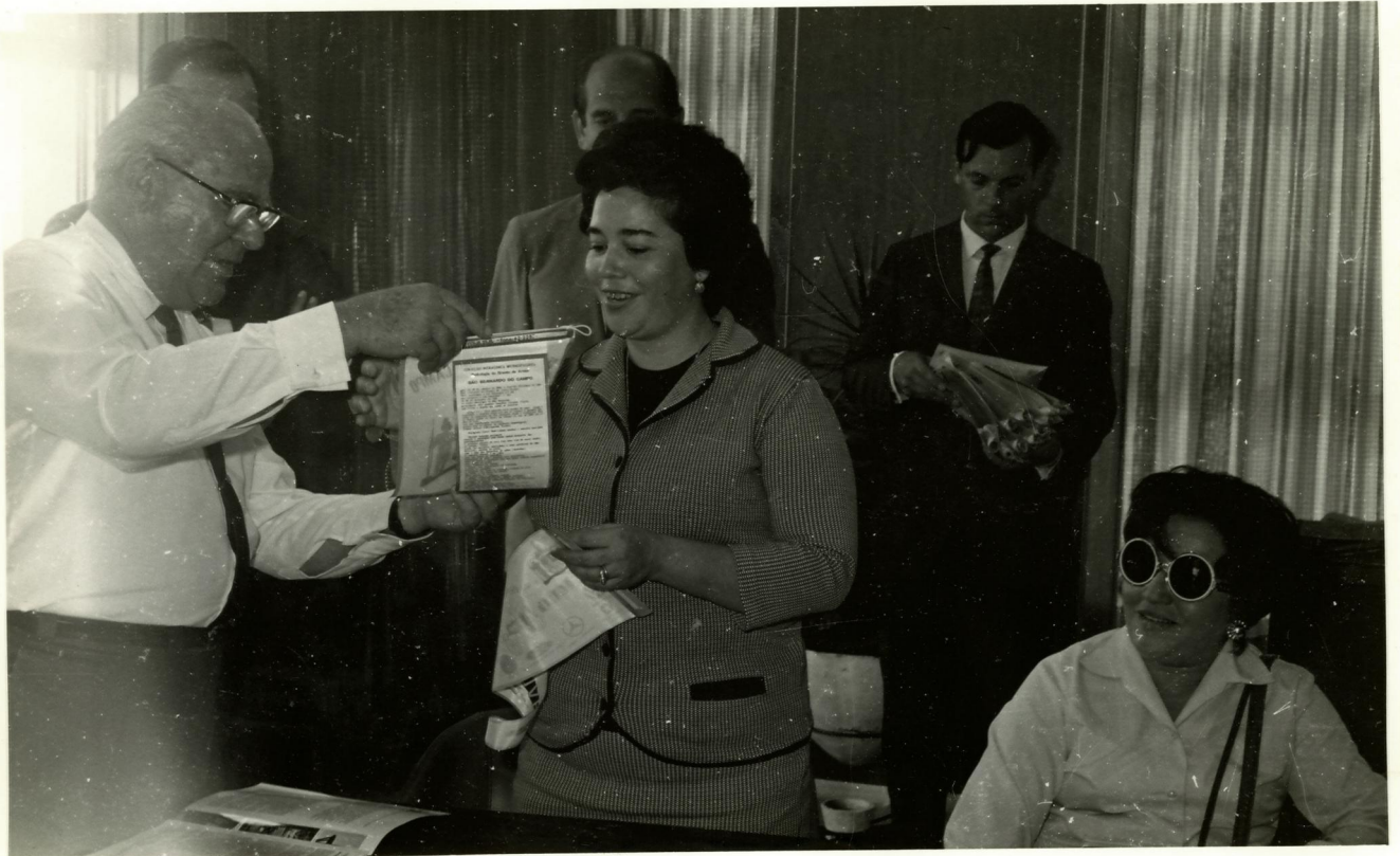
5. Com o Sr. Prefeito de São Bernardo do Campo.