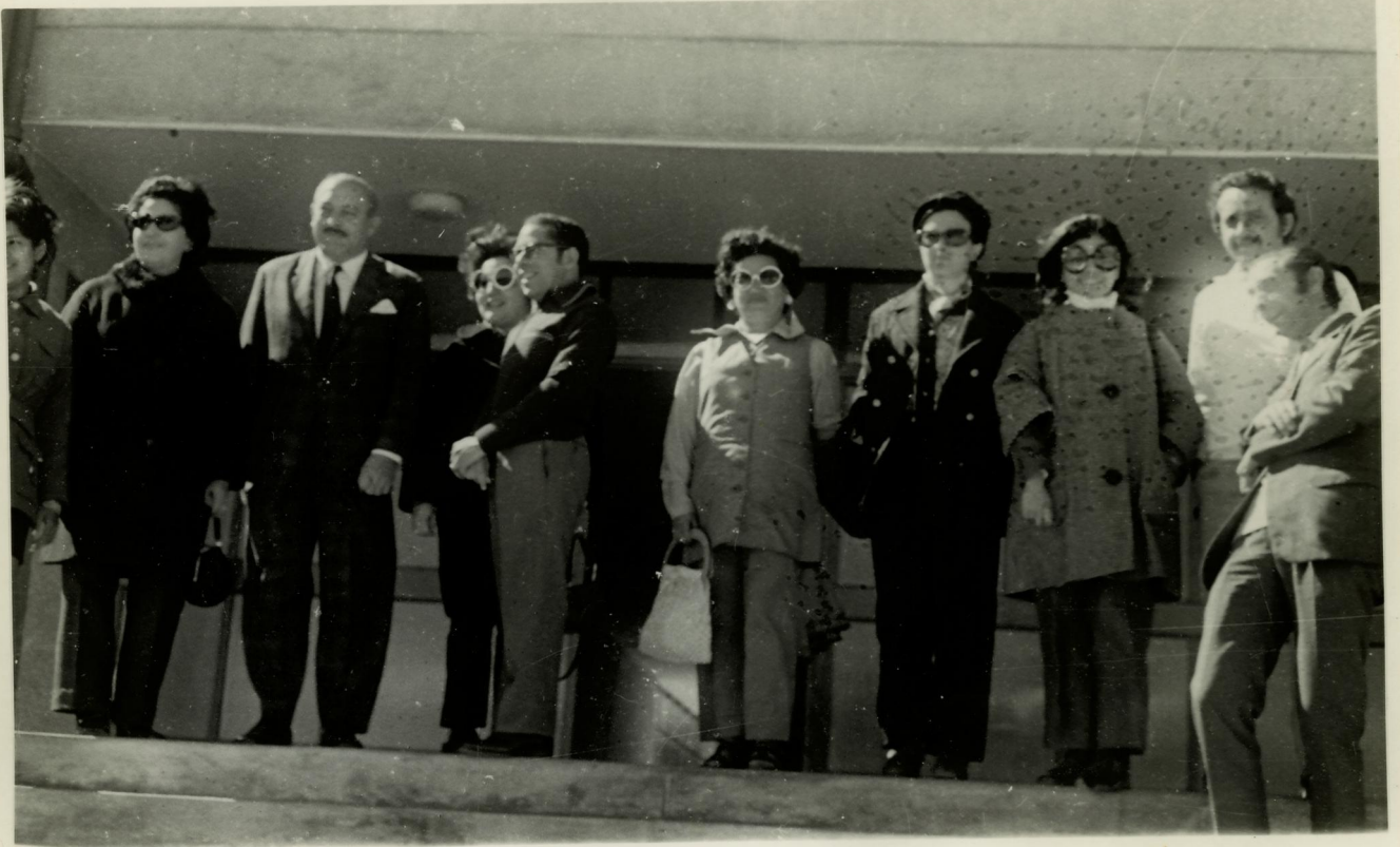
9. Grupo de bolsistas do II CASEAL em conjunto com bolsistas do IBECC.