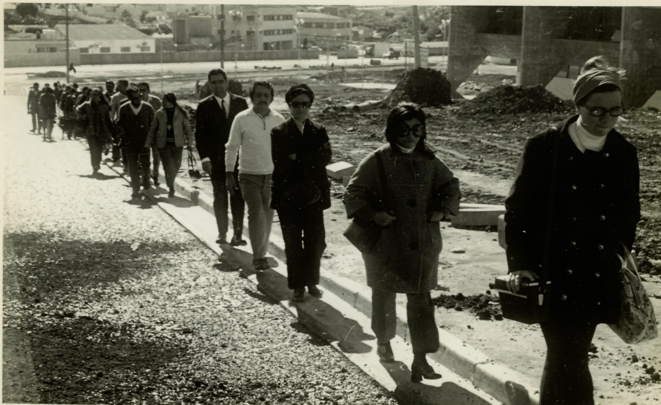
2. Em excursão