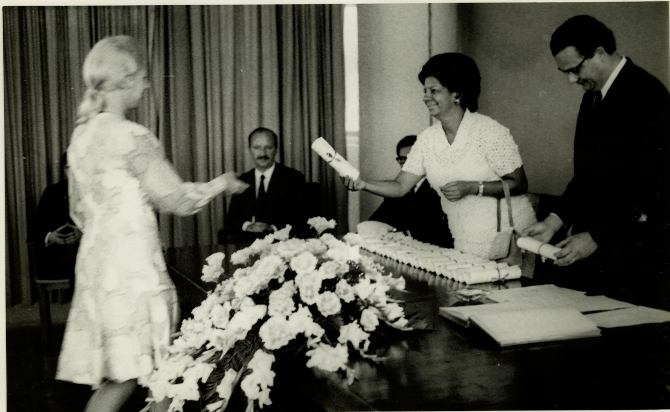
12. Entrega do certificado à bolsista do Uruguai.